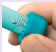
Aufsatz für die Dosierauswahl