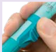
Aufsatz für den Auslöseknopf

Autopen® Zubehör ermöglicht eine noch einfachere Injektion für Menschen mit eingeschränkter Motorik.